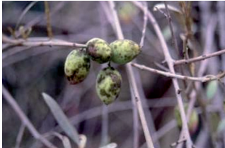
Repilo plumizo ( Pseudocercospora )