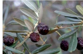
Aceituna jabonosa ( Colletotricum spp )