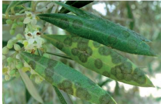
Repilo ( Spilotea oleagina )